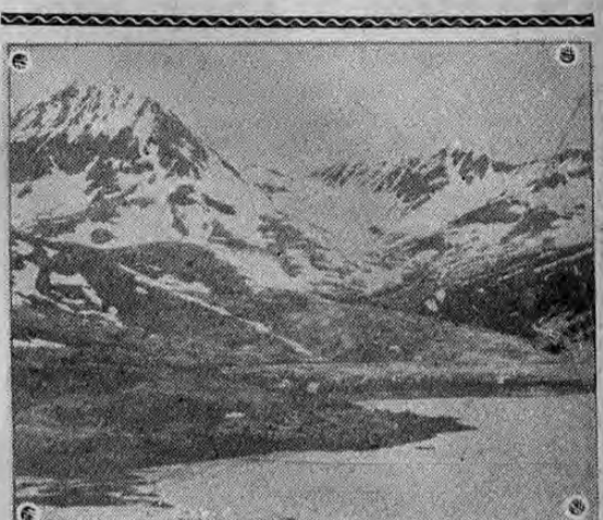
El desolado y triste paisaje de la isla Attu, una de las olvidadas y casi desiertas, islas de las Aleutianas occidentales, bajo el dominio de los Estados Unidos y donde han desembarcado fuerzas japonesas indudablemente con el propósito de amenazar Dutch Harbor. Esta isla ha sido constantemente atacada por la aviación americana desde que los nipones pusieron pie en ella.

MOSCÚ, 23, UP. — Las últimas informaciones que llegan de los frentes rusos indican que los alemanes han logrado avanzar en el frente de Karkov pero no en Sebastopol donde los rusos (PASA a la Pág. OCHO)